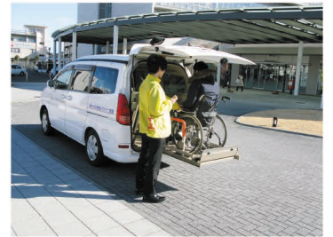
ワンボックス(日産セレナ)