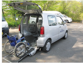
軽自動車(マツダAZワゴン)