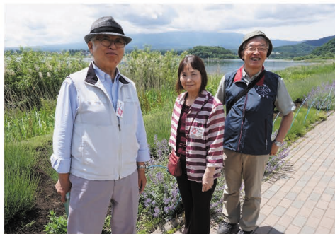
ひとりぐらし高齢者ふれあい旅行