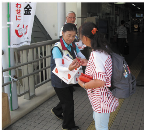
赤い羽根街頭募金