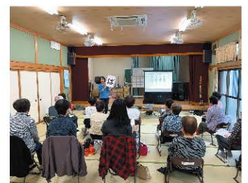
介護予防教室の開催