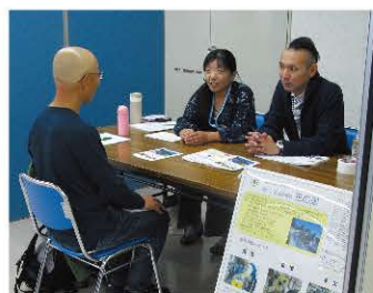
福祉施設の人材確保