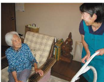
市民参加の家事支援