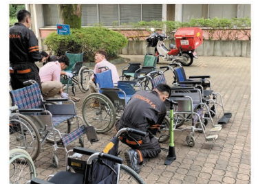
西東京カローラ様が年1回整備 をして下さいます。