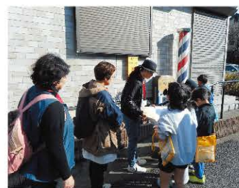
防犯・防災マップづくり