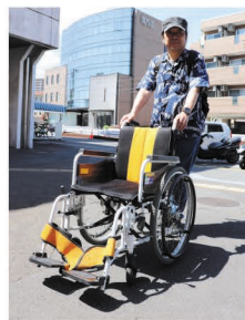
一般的なサイズで、折り たためば車にのります。