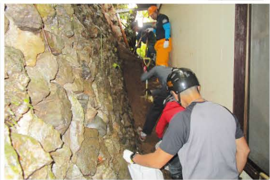
▲災害時のボランティア活動についても対応します

団体の立ち上げ支援や、助成金など活動に役立つ情報の提供、相談対応、会議室や備品の貸し出しなど、活動のサポートをしています。