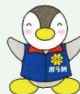
おうめ版ミンジー (東京都民生委員・児童委員のイメージキャラクター)