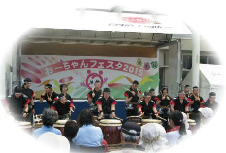
お〜ちゃんフェスタ (平成27年度)