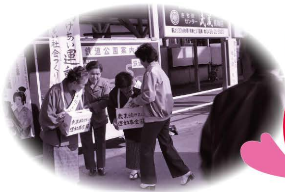
歳末たすけあい運動 街頭募金活動 (昭和43年度)

これからも、本会の基本理念である「人と人がつながり、支え合い、だれもが安心していきいきと暮らせるまち」の実現に向けて、皆様とともに歩んでいきます。