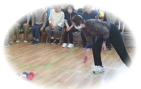
介護予防教室 (令和7年度)