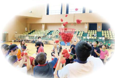
障がい者と家族のスポーツ大会 (令和元年度)