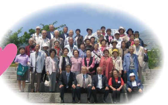
ひとりぐらし高齢者ふれあい旅行 (平成18年度)