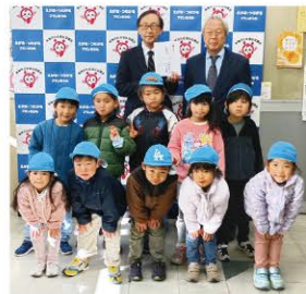
成木保育園 様 (園で育てた野菜の売り上げを ご寄付いただきました)