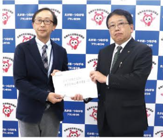
京セラ(株)東京青梅工場 様