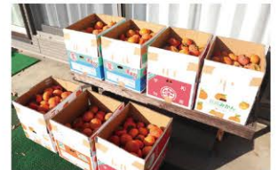
野村柿園 様 (柿のご寄付をいただき、 子ども食堂等に寄贈いたしました)