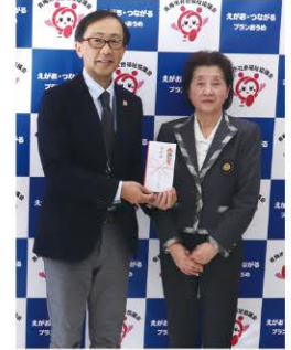
国際ソロプチミスト青梅 様