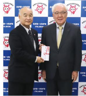
J A 西東京 様