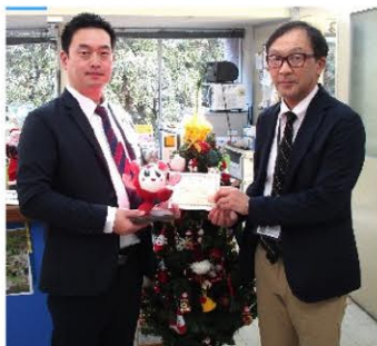
京セラ(株)東京青梅工場 様