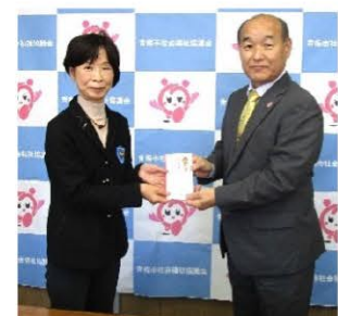
国際ソロプチミスト青梅 様