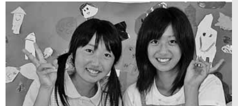
2009 夏体験ボランティアより