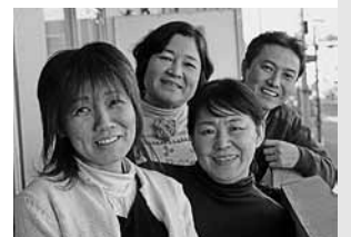
ホームページが充実してる子ども劇場西多摩

グループの活動を紹介したい方、イベント情報を発信したい方、ボランティアを募集したい方、ぜひセンターへご連絡下さい。