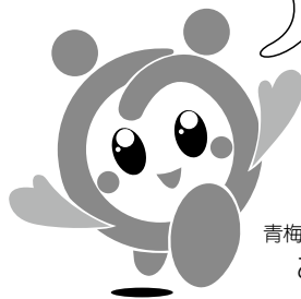
青梅のふくしキャラクター お~ちゃん

あけましておめでとう！ 今年も良い1年になりますように。 3月28日(日)に「第12回おうめ 市民ふくし祭」が開催されるよ！ 実行委員の中から代表して8名の メッセージを紹介するね♪